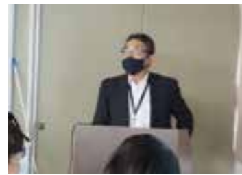
株式会社ベネッセソシアス様