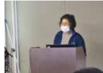
療育ねっとわーく川崎様