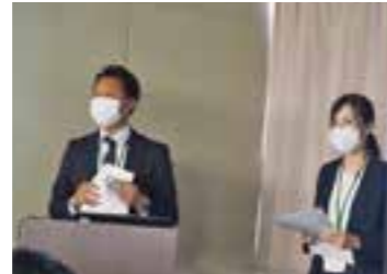
企業応援センターかわさき様