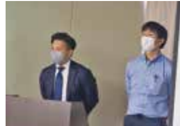
はーとふる農園(日建リース工業)様