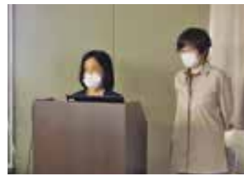
きしろメンタルクリニック ぶどうの樹様

たまフレ!から就職につながった企業様や連携する事業所様をゲストにお招きして、卒業生の事例や事業の概要について講演していただきました。ご講演いただいた皆様、ありがとうございます。